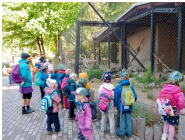
Včeličky a Schlumpfe v ZOO Liberec