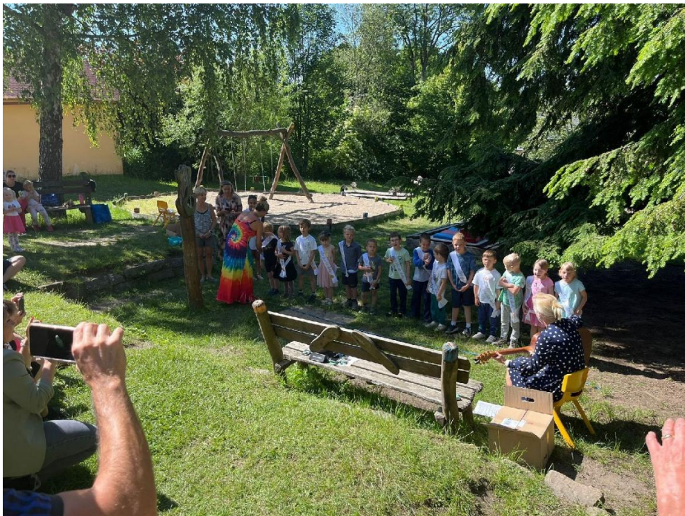
Rozloučení s předškoláky 2025