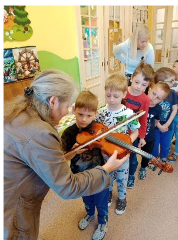
ZUŠ ve školce