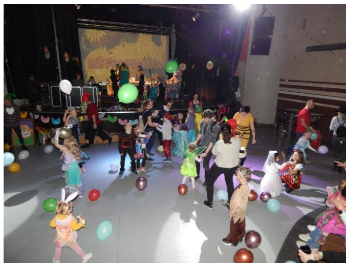
Sobotní karneval v klubu Woko