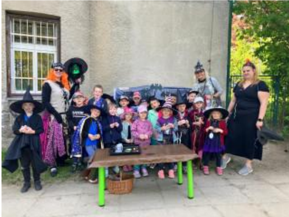
Stezka čarodějnice Elvíry